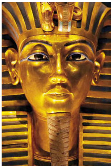
Farao Tutankhamon – verdens mest berømte maske!

21. – 30. april 2010 går årets spennende og annerledes bibelreise av stabelen. Vi følger i patriarkenes fotspor, og du vil raskt oppdage at Egypt ikke bare består av Tutankhamon, sfinksen og pyramidene... Tilbakemeldingene etter Norsk Bibelinstituttets (NBI) bibelreiser har vært overstrømmende positive, og nå er du velkommen til å bli med like inn i bibelhistorien, for ørkenen er der fortsatt, Nilen flyter romantisk og speilblank i solnedgangen mens handlegatene pulserer av liv og vi opplever at eksotiske krydderdufter pirrer lukteorganene våre.